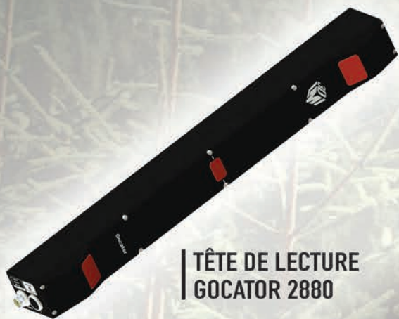
TÊTE DE LECTURE GOCATOR 2880

Scanneurs linéaires optimisés LMI Gocator 2880